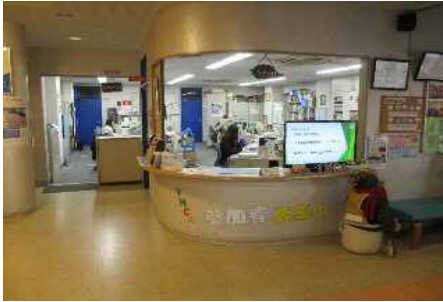
學校接待所櫃檯1樓