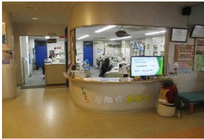
學校接待所櫃檯1樓