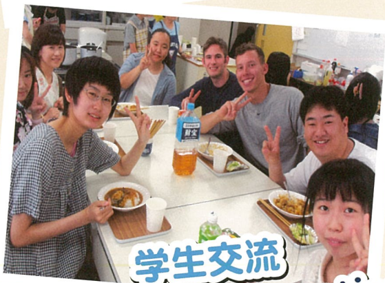
学生交流 Student Interaction