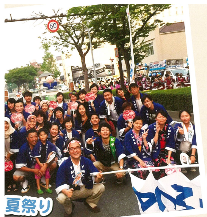
夏祭り Summer festival