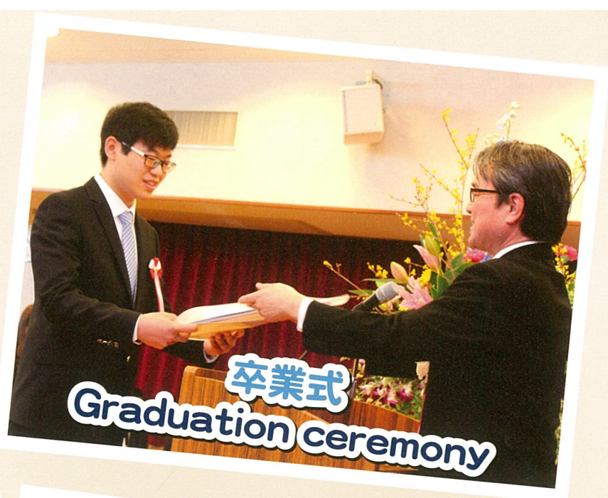
卒業式 Graduation ceremony