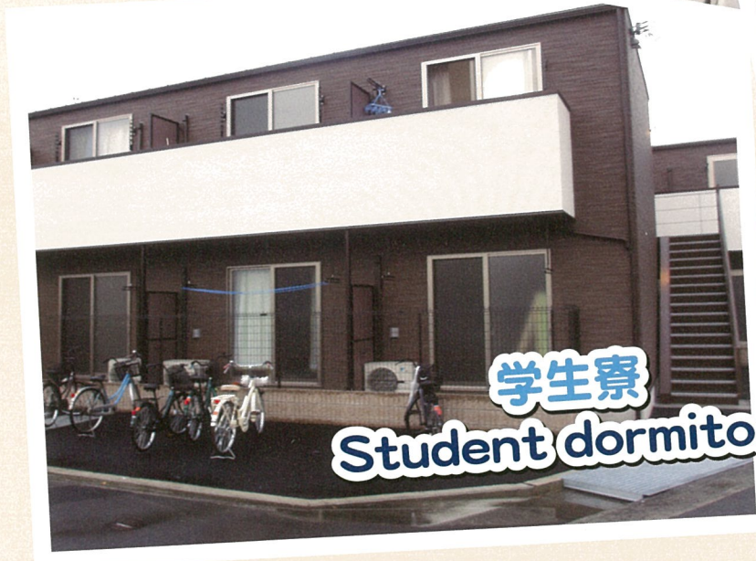
学生寮 Student dormitory