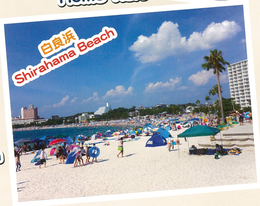
白良浜 Shirahama Beach