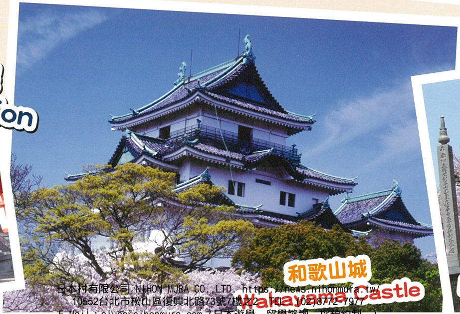
和歌山城 Wakayama Castle