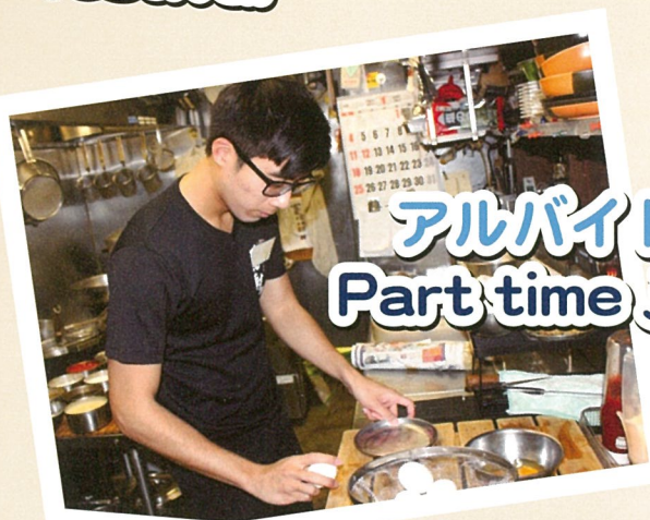
アルバイト Part time job