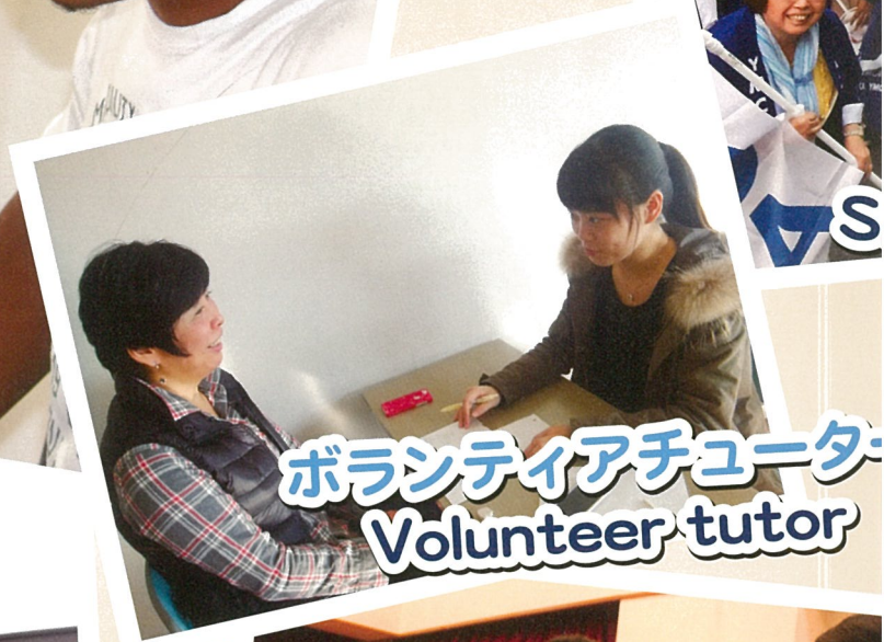
ボランティアチューター Volunteer tutor