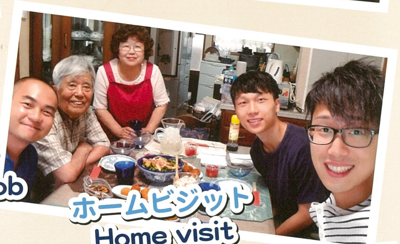
ホームビジット Home visit