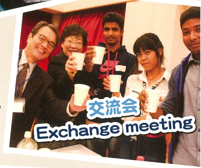
交流会 Exchange meeting